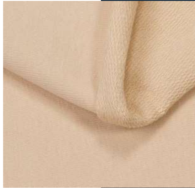
Футер 2х нитка