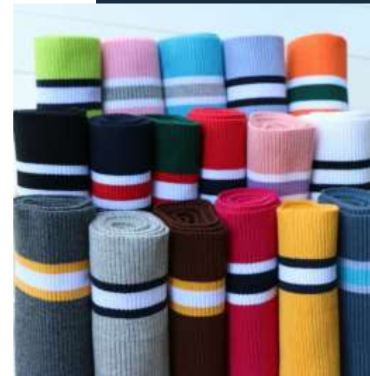
Воротники и манжеты